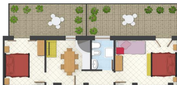
Trilocale "C": mq 50 Appartamenti 4 – 9 – 14 PERSONE 4+(2)

Cucina, 1 camera matrimoniale + letto a castello a scomparsa, 1 camera matrimoniale, lavatrice, bagno WC e doccia, TV-SAT, 2 terrazzi, vista su via principale.