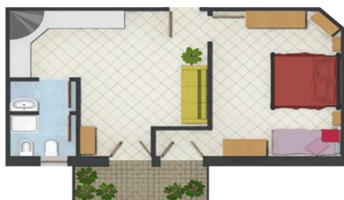
Bilocale "B": mq 40 Appartamenti: 1 – 6 – 11 PERSONE 3+(1)

Soggiorno con angolo cottura, camera matrimoniale più 2 letti, bagno WC e doccia, terrazzo, TV-SAT, lavatrice, posizione tranquilla.