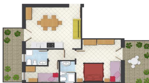
TRILOCALE "E": mq 50 Appartamenti 5 – 10 PERSONE 4+(2)

Soggiorno con angolo cottura, 1 camera matrimoniale + letto a castello a scomparsa, 1 camera con letto a castello, 2 bagni WC e doccia, lavatrice, TV-SAT, 2 terrazzi uno con vista su via principale e uno con vista mare.