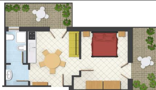
Bilocale "A": mq 25 Appartamenti: 3A – 8A - 13A (PERSONE 2)

Cucina con divano, camera matrimoniale, 2 terrazzi, bagno WC e doccia, TV-SAT, lavatrice, vista su via principale.