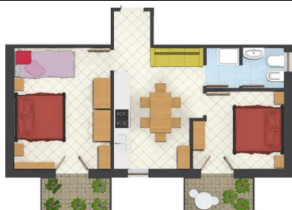
Trilocale "D": mq 50 Appartamenti 2 – 7 – 12 PERSONE 4+(2)

Cucina con divano, 1 camera matrimoniale, 1 camera matrimoniale con letto a castello, bagno WC e doccia, 2 terrazze, lavatrice, TV-SAT, posizione tranquilla vista mare.